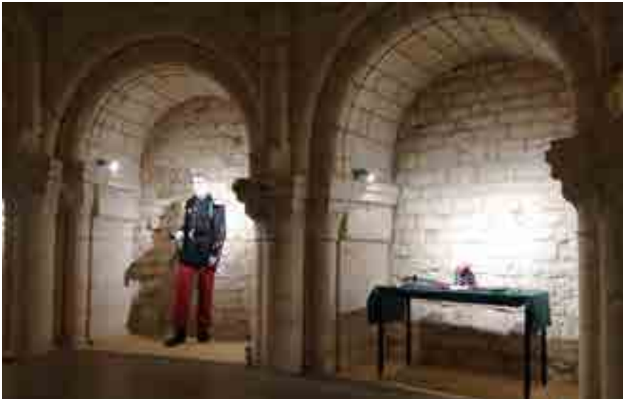
CÉRÉMONIE SAINT-CYR AUSTERLITZ 2 DÉCEMBRE

Le soleil de Napoléon s'est levé devant la terrasse à 7h50 le 2 décembre dernier.