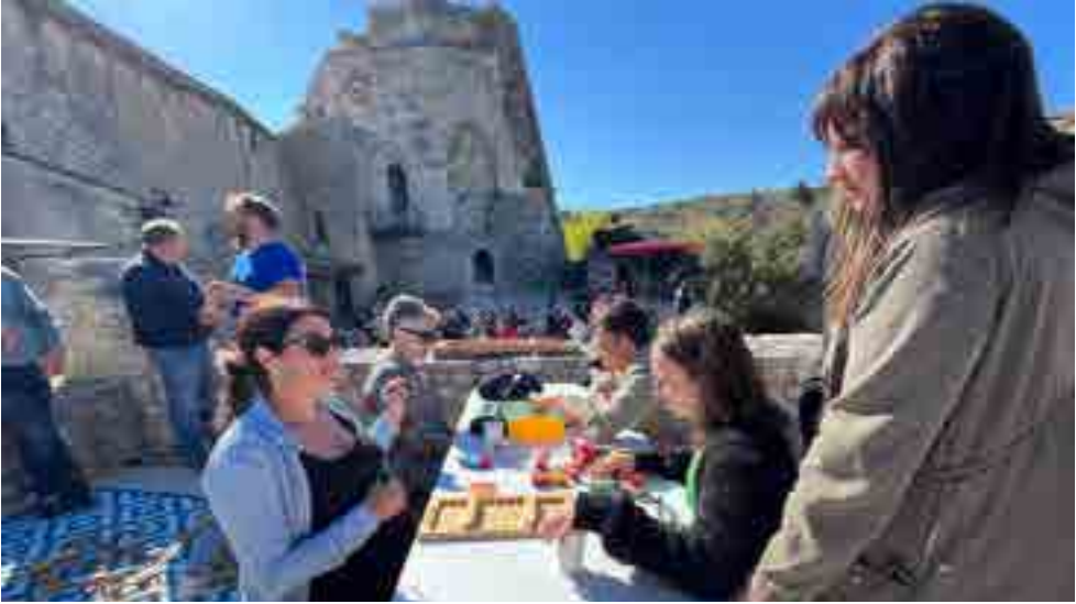
CHASSE AUX OUFES

responsable pour tous travaux dans un monument historique) pour une réfection complète des huisseries, réparation, peinture. Le mur nord, dont la dégradation depuis quelques années est inquiétante, voit sa rénovation programmée pour l'année 2023, ainsi que la mise aux normes de sécurité des rambardes autour de la terrasse. Pour que l'utilisation de celle-ci soit optimisée, la commune a financé l'équipement d'une salle dite de « chauffe » à côté de cette terrasse, comprenant tous les équipements nécessaires à une petite restauration, et travaille à la mise en place de dispositifs pour se protéger contre l'ensoleillement excessif en saison.