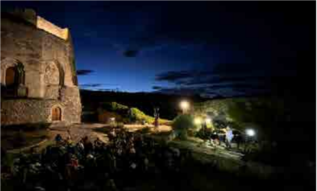
CONCERT DANS LA COUR DU CHÂTEAU

Prenez encore les Ados de Simiane. En voilà des jeunes pleins d'allant et de générosité !