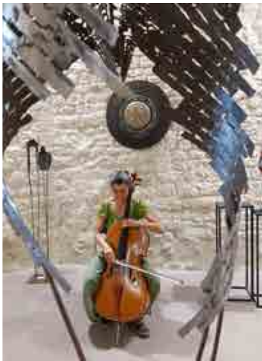
MUSIQUE ET SCULPTURE

L'offre de restauration est essentielle.