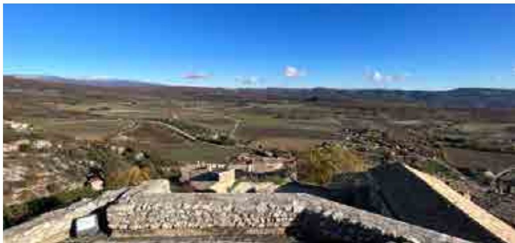
SOMMET DE LA ROTONDE

La Rotonde de Simiane, donjon du XI e siècle, a été remarquée et classée dès 1841 par le créateur de l'inventaire des monuments historiques, l'écrivain Prosper Mérimée. En 1954, l'importance pour la commune d'abriter un tel monument est consacrée dans son nom :